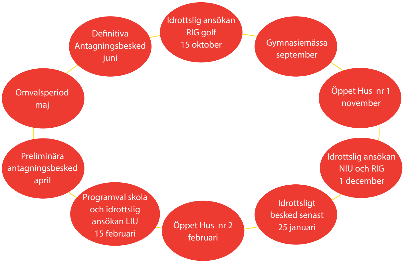
NIU och RIG amerikansk fotboll