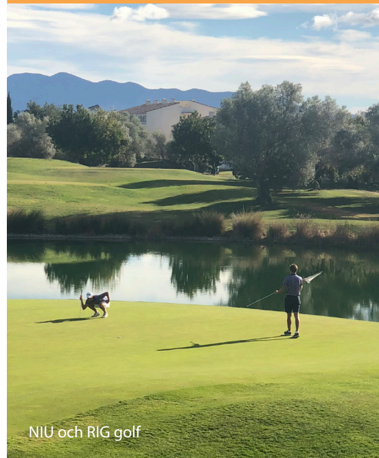
NIU och RIG golf